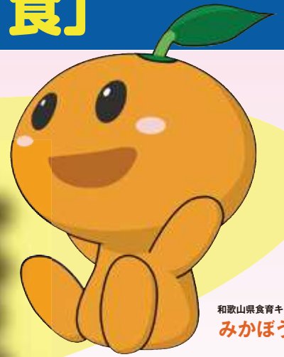
和歌山県食育キャラクター みかぼう