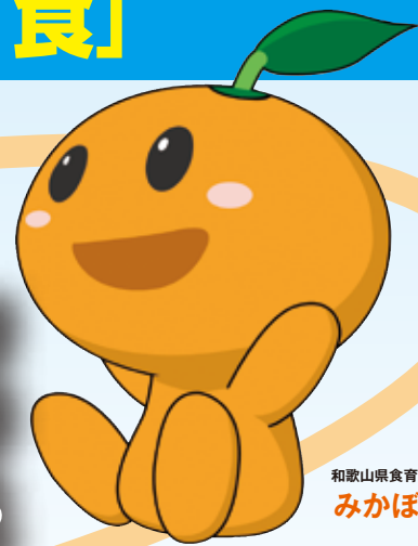
和歌山県食育キャラクター みかぼう