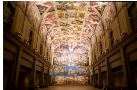
システイーナ・ホール (写真は、大塚国際美術館の展示作品を撮影したものです。)