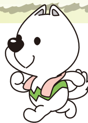
和歌山県PRキャラクター きいちゃん