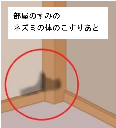
部屋のすみの巣穴の入り口